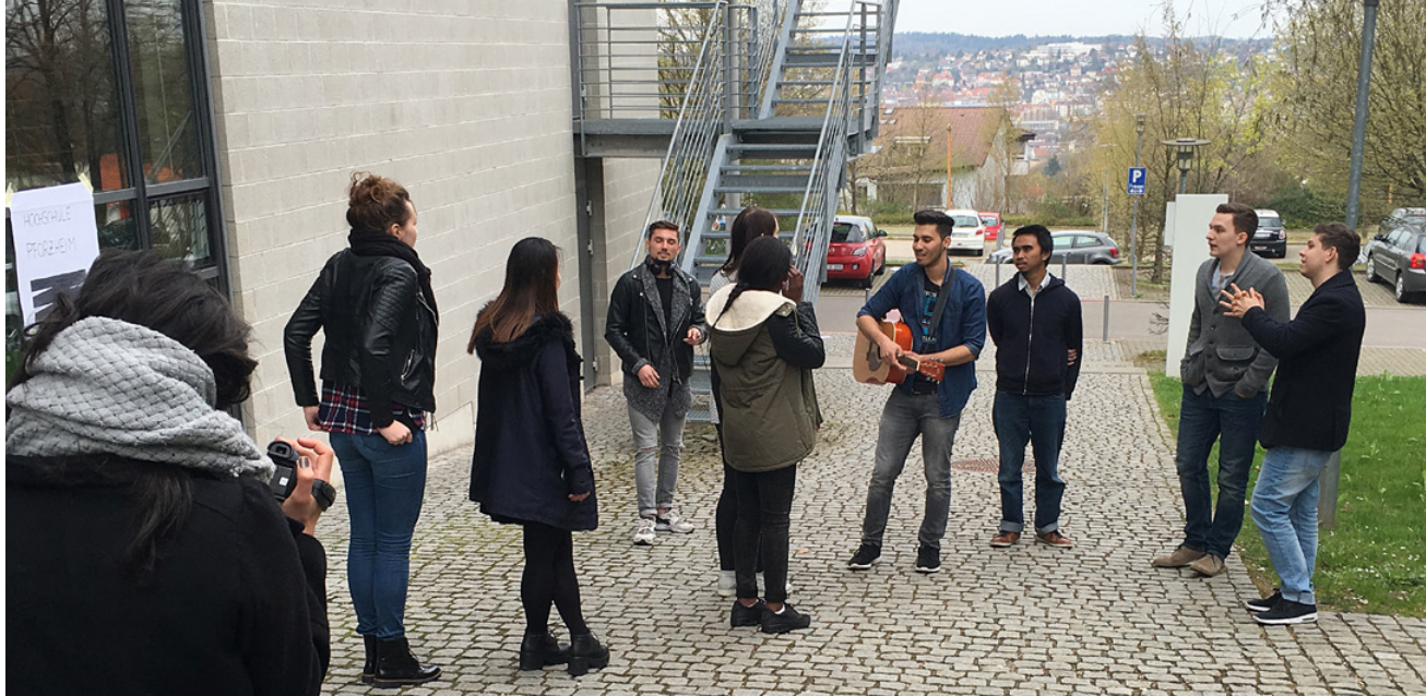
Teamarbeit live.

nutzen. Wenn die Auswahl für das SIK-Programm stattfindet, ist die Zielgruppe außerdem gerade im Praxissemester, was das Auswahlverfahren deutlich erschwert. Zumindest für den ersten Teil (Kommunikationstraining und Teamarbeitstraining) des SIK-Programms werden darum auch Studierende aus dem 3. oder 4. Semester als Tutoren eingesetzt. Für den zweiten Teil (Präsentationstraining) sollten die Tutoren selbst bereits umfangreiche Erfahrungen mit Präsentationen an der Hochschule und im Praktikum gesammelt haben. Die Tutoren werden – soweit möglich – anhand von persönlichen Auswahlgesprächen ausgewählt und erhalten einen Vertrag als studentische Hilfskraft. In einem ausführlichen Train-the-Trainer-Seminar, das von erfahrenen Trainern geleitet wird, lernen die Tutoren nicht nur die Inhalte der einzelnen Trainings kennen, sondern werden auch mit dem methodischen Know-How eines Trainers vertraut gemacht.