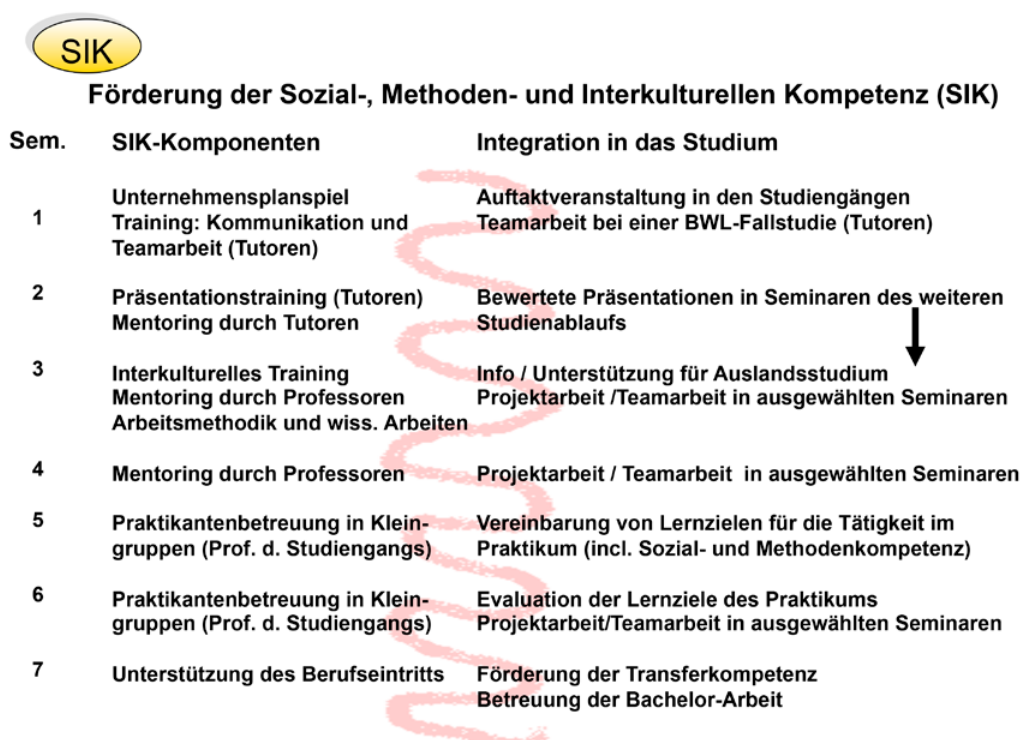
Abb. 2: Einbindung der Schlüsselkompetenzen in das Studium – der rote Faden.

Durch die Abschaffung der Wehrpflicht und die Verkürzung der Gymnasialzeit hat sich der Anteil jüngerer Studienanfänger