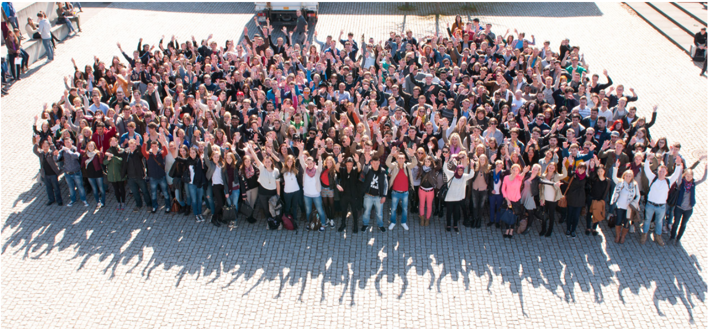
Die Erstis des Sommersemesters 2014