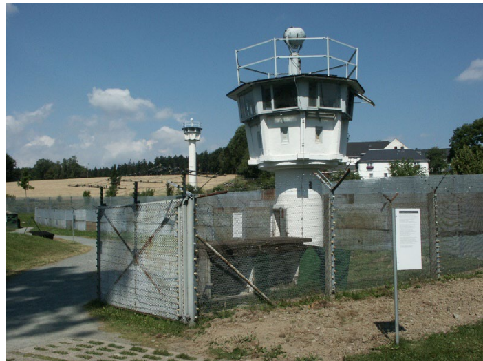
Ehemaliger Schutzstreifen und Wachturm der Grenze zwischen der BRD und der DDR

Natürlich kommt auch der kulturelle Aspekt nicht zu kurz. Haben Sie schon von Dorf Mödlareuth gehört? Es repräsentiert die symbolische Trennung der BRD von der DDR im 20. Jahrhundert. Welche Rolle dieses Dorf gespielt hat und welche weiteren interessanten Fakten es über die Ost-West-Trennung gibt, erfahren die Beteiligten der Exkursionswoche im Deutsch-Deutschen Museum Mödlareuth.